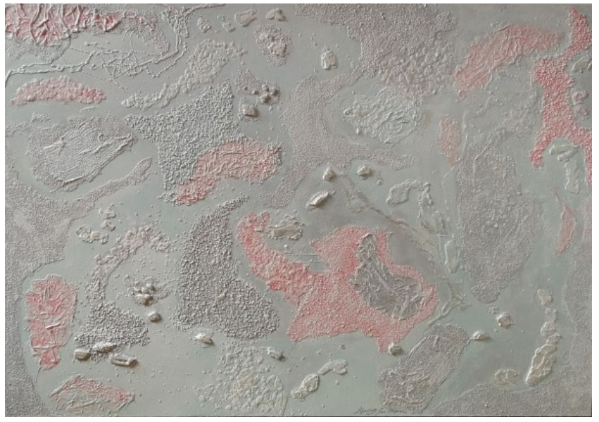
Finnish Mindscape (Winter) , (Suomalainen mielenmaisema, Talvi), sekatekniikka MDF-levylle, 70 cm x 100 cm