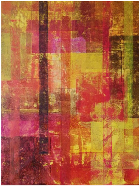
Desert Blooms (Aavikko kukkii), 2017, akryyli kankaalle, 79 cm x 60 cm