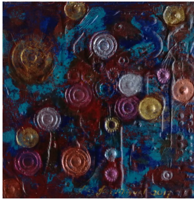
A Mechanical Universe (Mekaaninen universumi), 2017, akryyli MDF-levylle, 22 cm x 22 cm