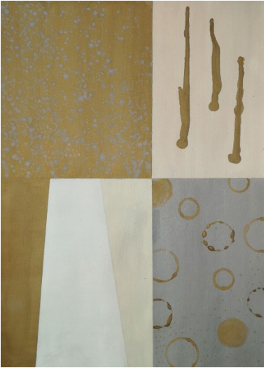
Life from Spring Rains , (Elämää kevätsateesta), 2004, akvarelli ja guassi akvarellipaperille, 37 cm x 27 cm