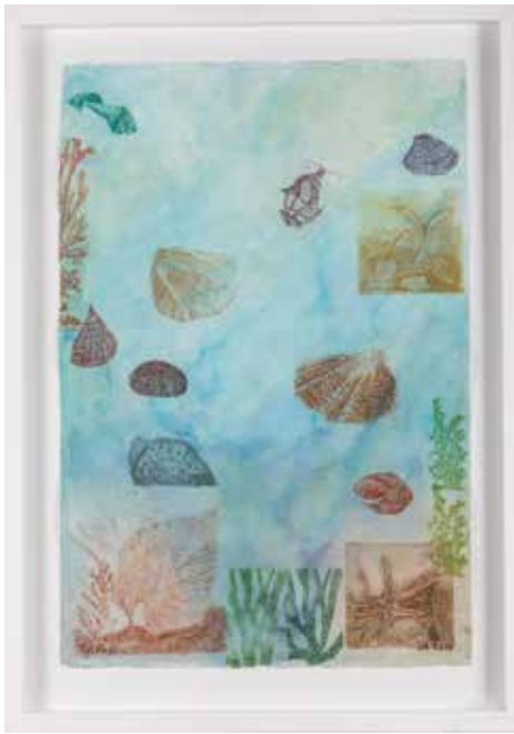
"Reviirit", akvarelli, akvatinta, 2012, 55x37 cm