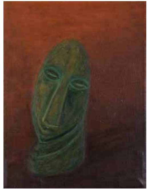
"Shona-kasvo", akryyli, 2017, 40x30 cm