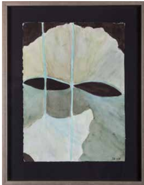
"Neidonhiuspuu", akvarelli, 2015, 38x28 cm