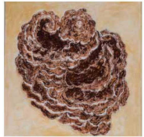
Ruskea koralli , sekatekniikka, 2017, 60x60 cm