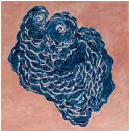
Turkoosi koralli , sekatekniikka, 2017, 60x60 cm