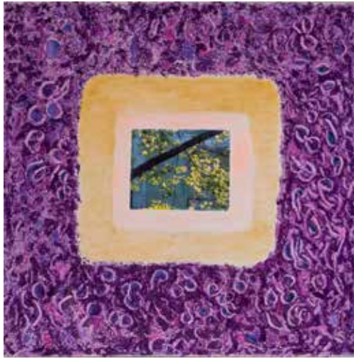
Oksa ikkunassa , sekatekniikka, 2017, 90x90 cm