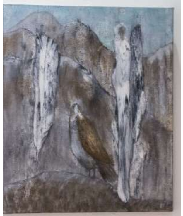
Merkkejä, 2017, akryliväri