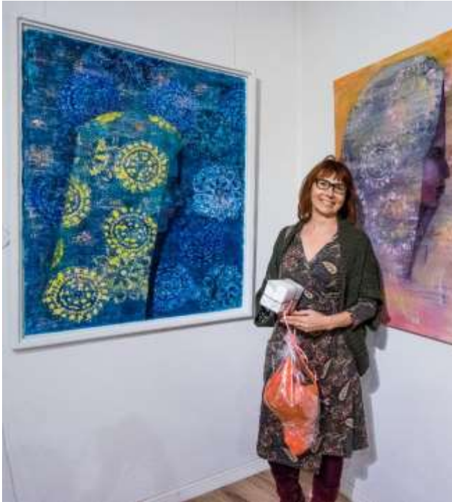
Omantien kulkijat I&II, 2017, öljyväri & akryliväri