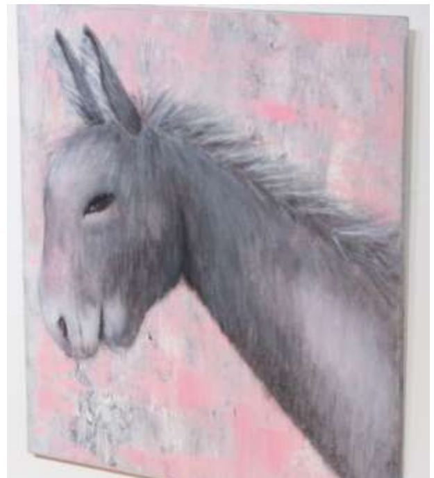
Aasin viisautta, 2017, akryliväri

Maalaaminen vahvisti jälleen, kuinka tärkeää on luottaa ja kulkea omaa polkuaan, merkkejä seuraten, pilke silmäkulmassa .