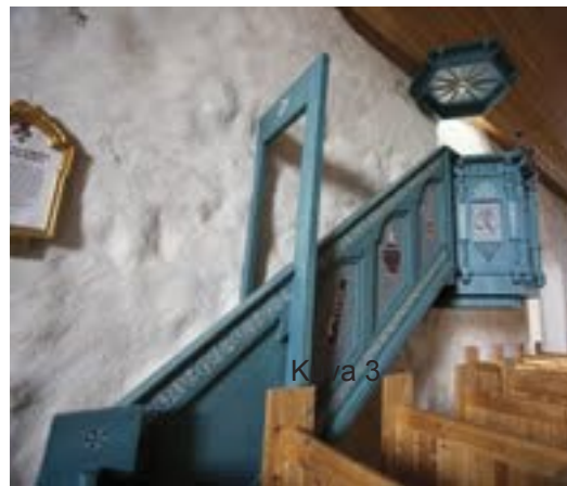
Kuvat 3 ja 4

Kuva 1. Kuutti Lavonen maalasi kirkon lehtereihin Via Crucis -sarjan työt lähtökohtana Anders Löfmarkin 1700-luvun maalaukset. Kristinuskon kohdat: luominen, lunastus ja viimeinen tuomio.