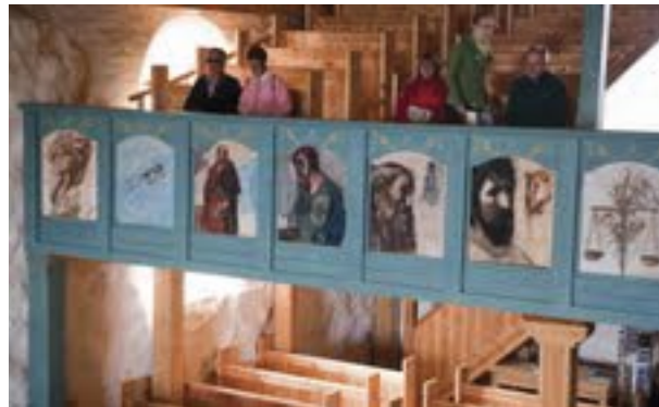
Kuvat 1 ja 2