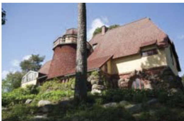
Kuvat 5 ja 6

Kuva 3. Osmo Rauhala : Alttarialue. Vasemmalla luomiskertomusta, Taus-talla Pääskysel (ylinnä), Pyhä Henki laskeutuu (vas), Sunnuntaiamu ja edessä keskellä Karitsa.