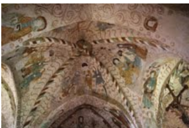
Kuvat 7 ja 8

Kuva 6. Keskieurooppalaista jugendia henkivä ateljeerakennus on kuin pieni linna.